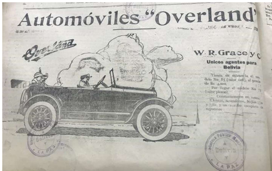
Figura 5. Automóvil Overland