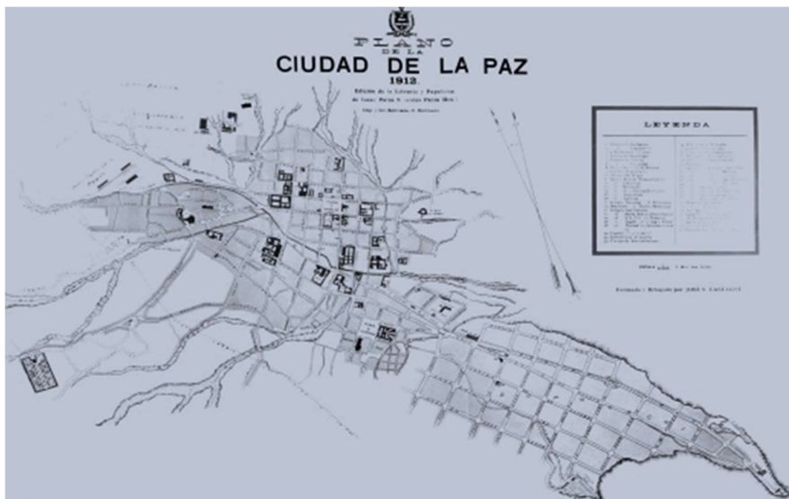
Figura 2. Plano de La Paz 1912