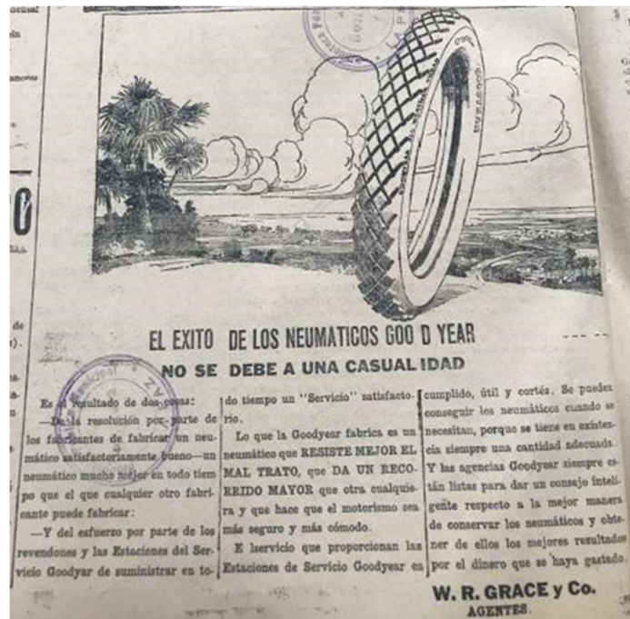
Figura 6. Anuncio Goodyear